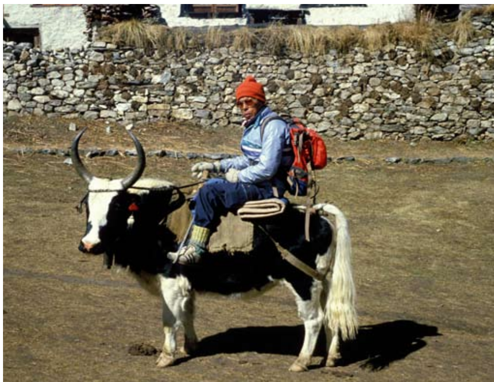
Trekking i Khumbu

Styret ønsker alle medlemmene en riktig god sommer !