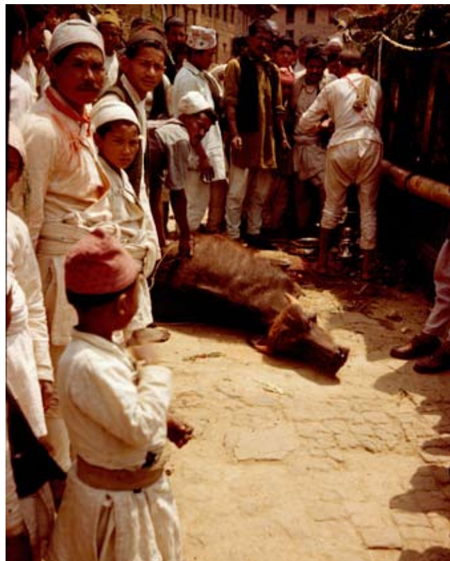
Klar til ofring.