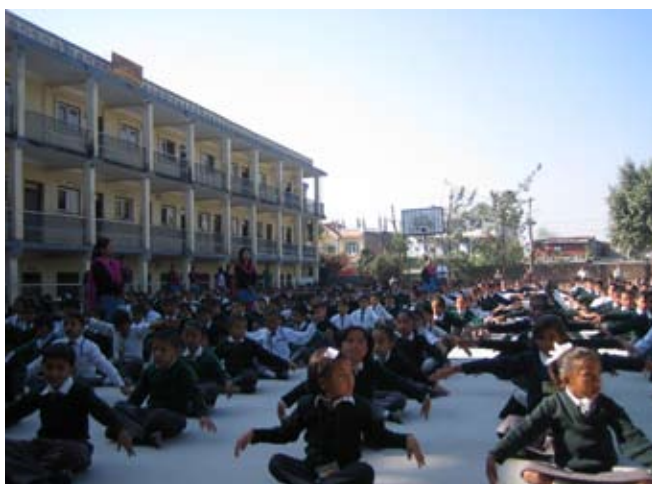
Oppstilling med morgengymnastikk i skolegården i Kathmandu, 2007.