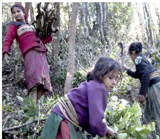
Opprensning i den kommunale skogen.