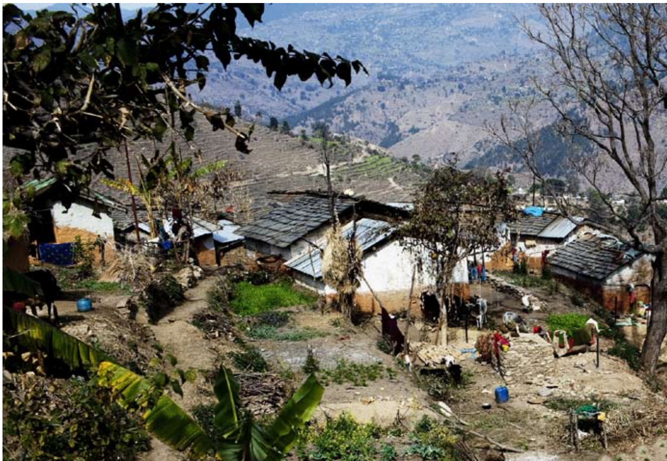
Landsbyen Bodali.

og bodde der i to uker for å dokumentere haliya-systemet i landsbyen Bodali som ligger omkring 8 km fra Dadeldhura. Haliya betyr "den som pløyer". Den 6. september 2008 erklærte den nepalske regjeringen at Haliyaene skulle være frie og gjelden deres bli slettet, men det er fortsatt mange som tvinges til å arbeide på landeiernes jord, blant annet i Bodali. Anette fortalte at 20.000 husholdninger er registrert som Haliyaer i Vest-Nepal, herav er 97% dalitter. De fleste haliyaer tilhører kasten dalit-