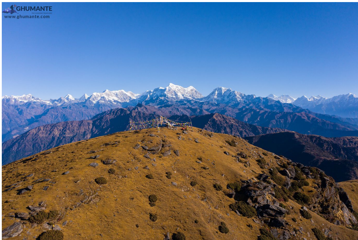
Pikey Peak, Solu

En av de best bevarte hemmelighetene når det gjelder fotturer i Nepal er Pikey Peak i Solu, som gir utsikt over syv av Nepals åtte topper på over 8000 meter fra ett sted, inkludert Mt Everest. Pikey Peak er 4 065 meter høy, men oversett av de fleste turgåere på Everest-stien. Nå har veien fra Kathmandu til Jiri og Solu Highway nådd Phaplu via Okhaldhunga, og Pikey er tilgjengelig for turgåere i alle aldre.