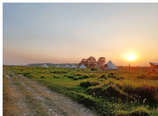
Villmarkscamping i Bardia