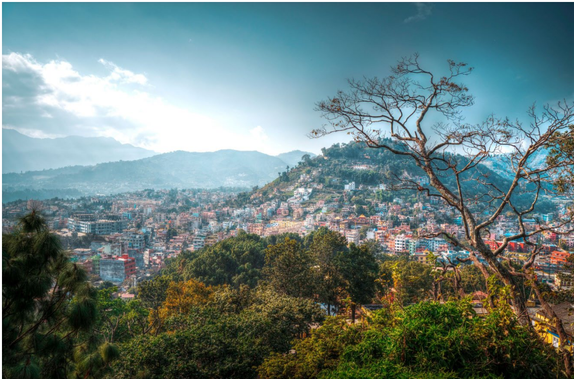
UTSIKT over Kathmandudalen Utsikt over Kathmandudalen