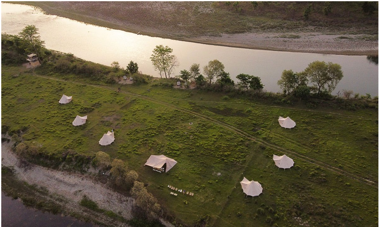
Burhan Wilderness Camp sett fra luften

Campingplass i Bardias natur fornyer økoturisme. De setter lokalsamfunnet først, samtidig som de bevarer naturen.